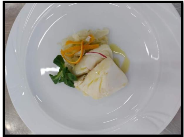
Baccalà in olio cottura, finocchi e arance