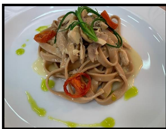
Tagliatelle di farina di castagne con ragù di cappone