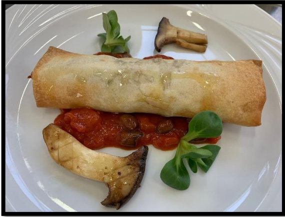
Ricordo di pollo alla cacciatora