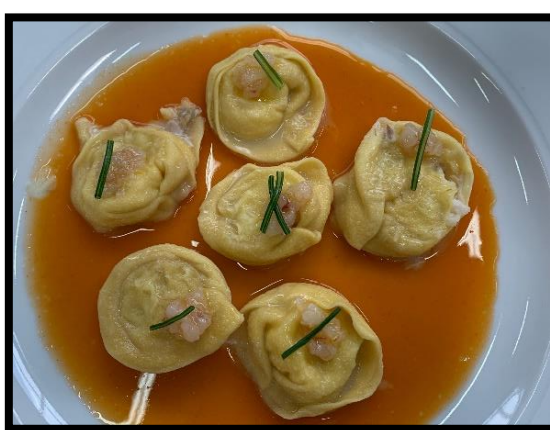
"Tordelli" di mare con tartare di gamberi