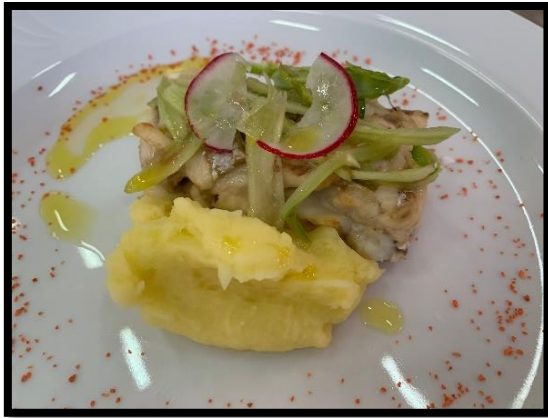
Bianco di spigola con puntarelle, patate al limone