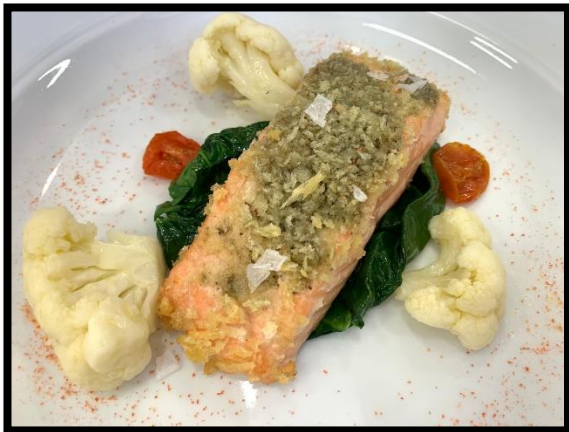
Salmone grigliato, crema di lardo, cavolfiore all’agro