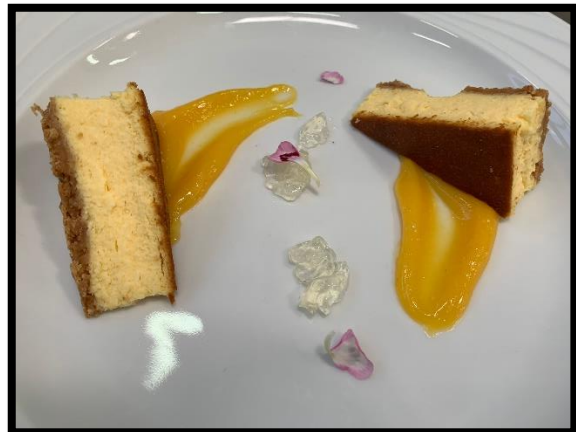
Cheesecake al limone