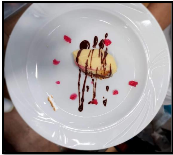
Crema di latte con Alchermes e cioccolato