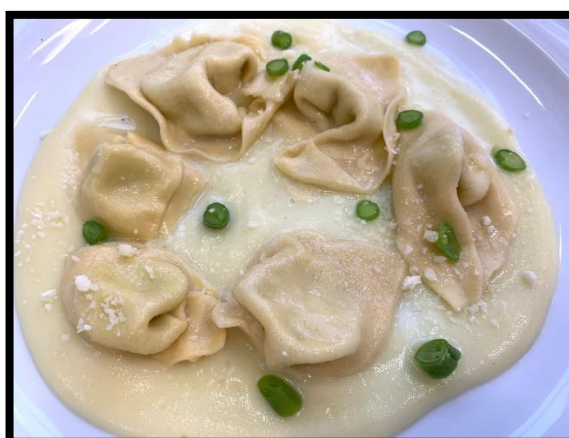
Cappellacci con pesto, cremoso di patate, fagiolini