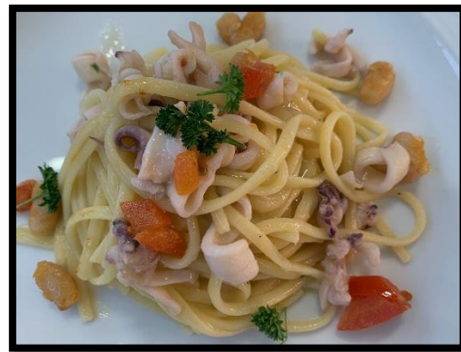
Linguine, calamari, cannellini e savia