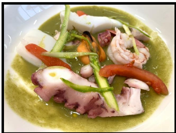
Insalata di mare Tirrenoct