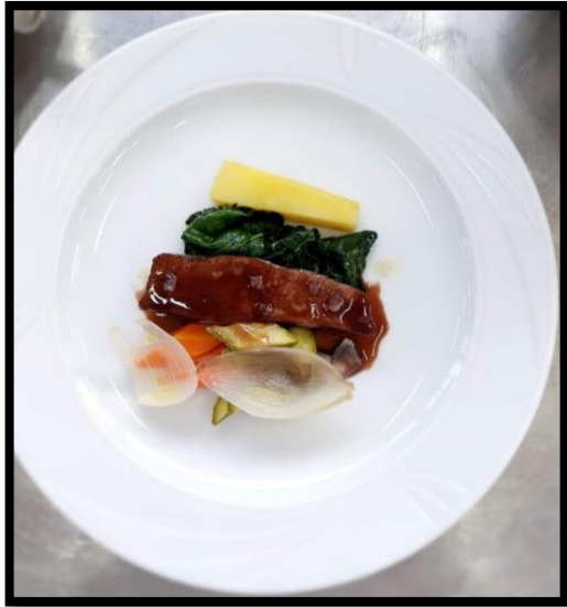
Sorra al Chianti, verdure al sale marino