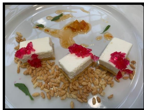
La torta di riso 20.22