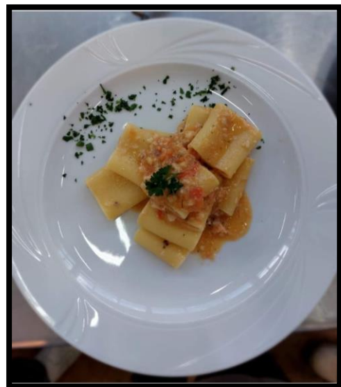
Paccheri alla "trabaccolara"