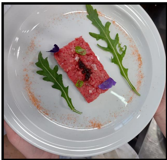
Chianina al coltello con bottarga di gallina