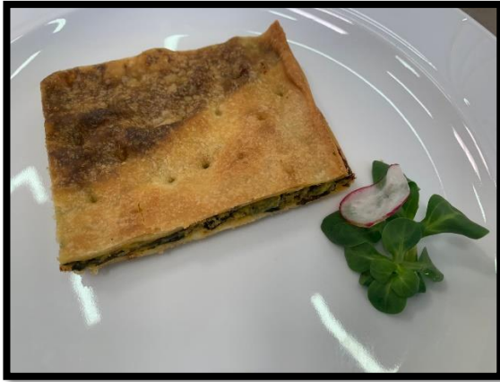
Tradizionale torta d'erbi della Lunigiana