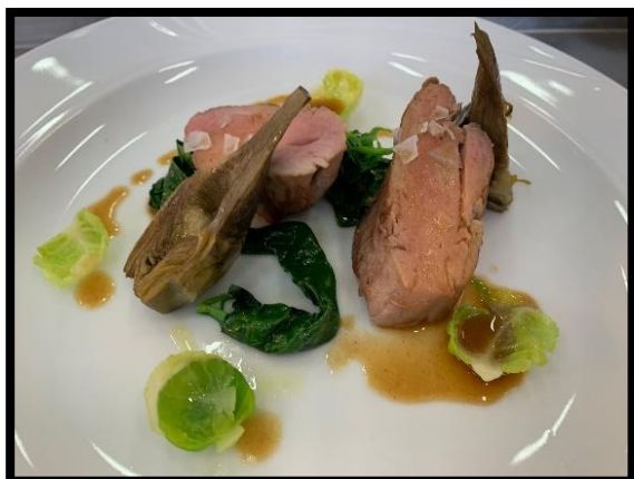
Filetto di cinta senese con carciofi al timo