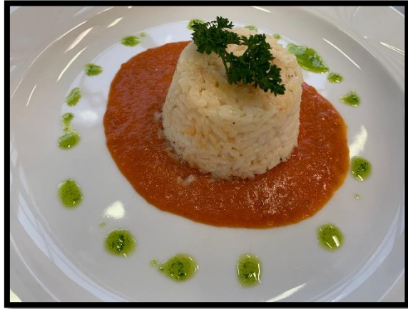
“Bomba” di riso con caciucco