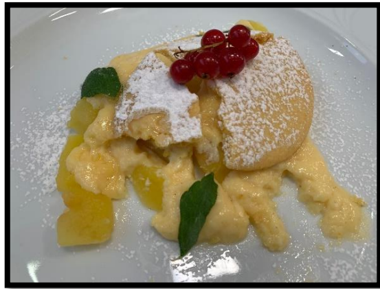
La nostra torta di mele