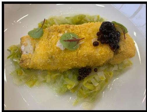
Ombrina in crosta di mais, zuppetta di porri