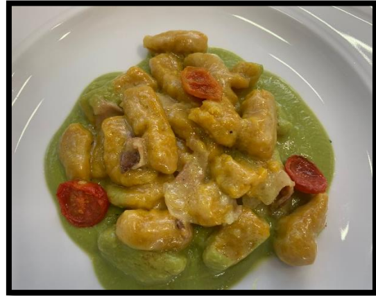
Gnocchi di patate alla curcuma con guanciale e piselli