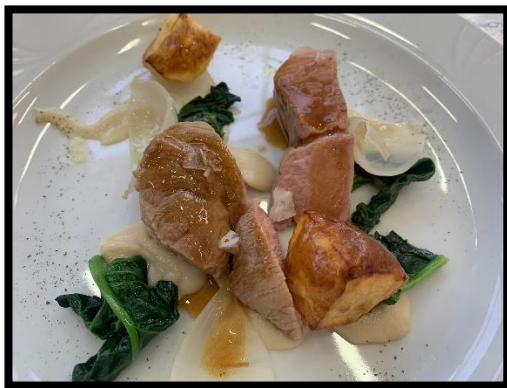
Vitella affumicata, topinambur, petali di cipolle