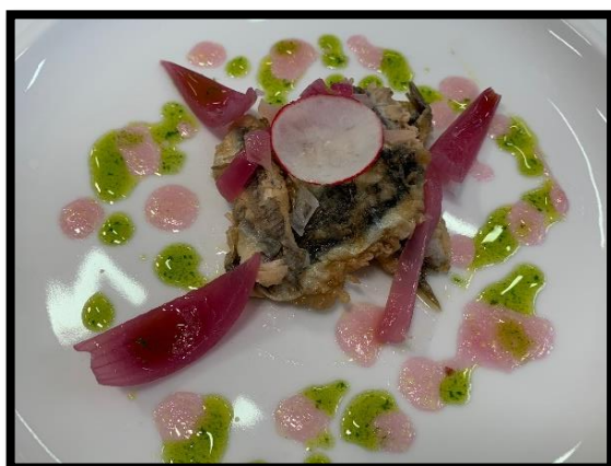
Acciughe delle Cinque Terre "a scapece"